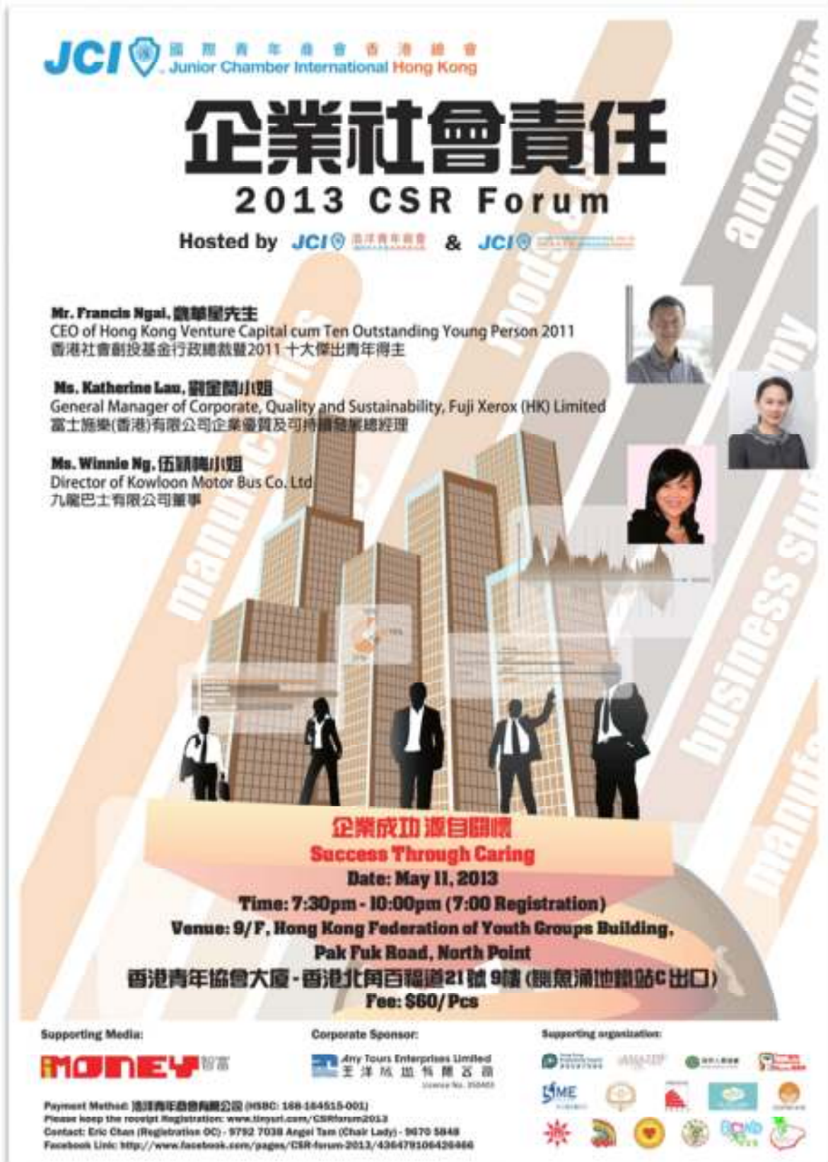
Poster for CSR Forum 2013