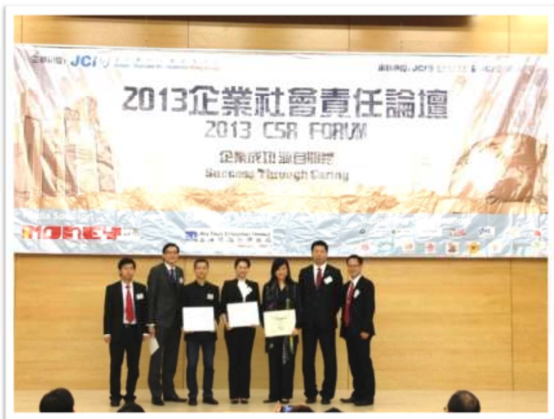
Guests and speakers receive token of apperception