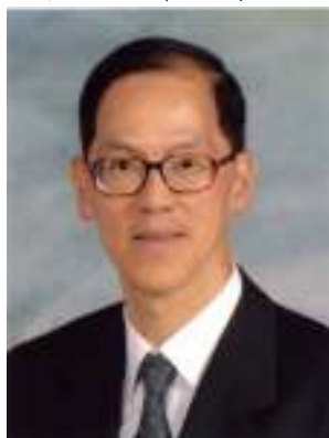
民政事務局局长 曾德成, GBS, JP