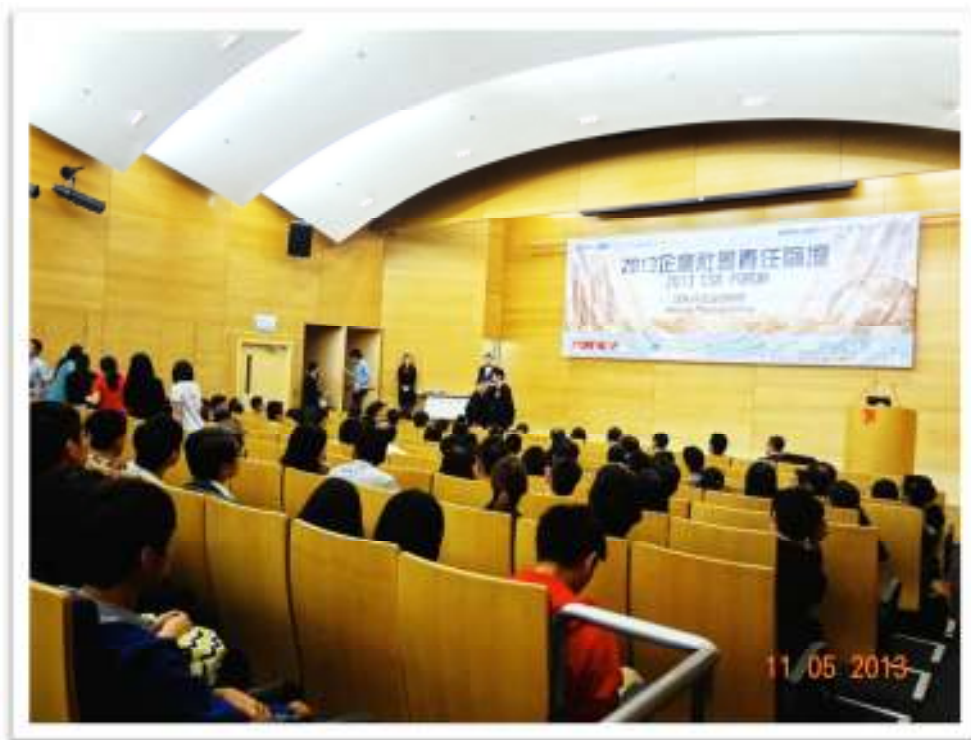
Full house attendance