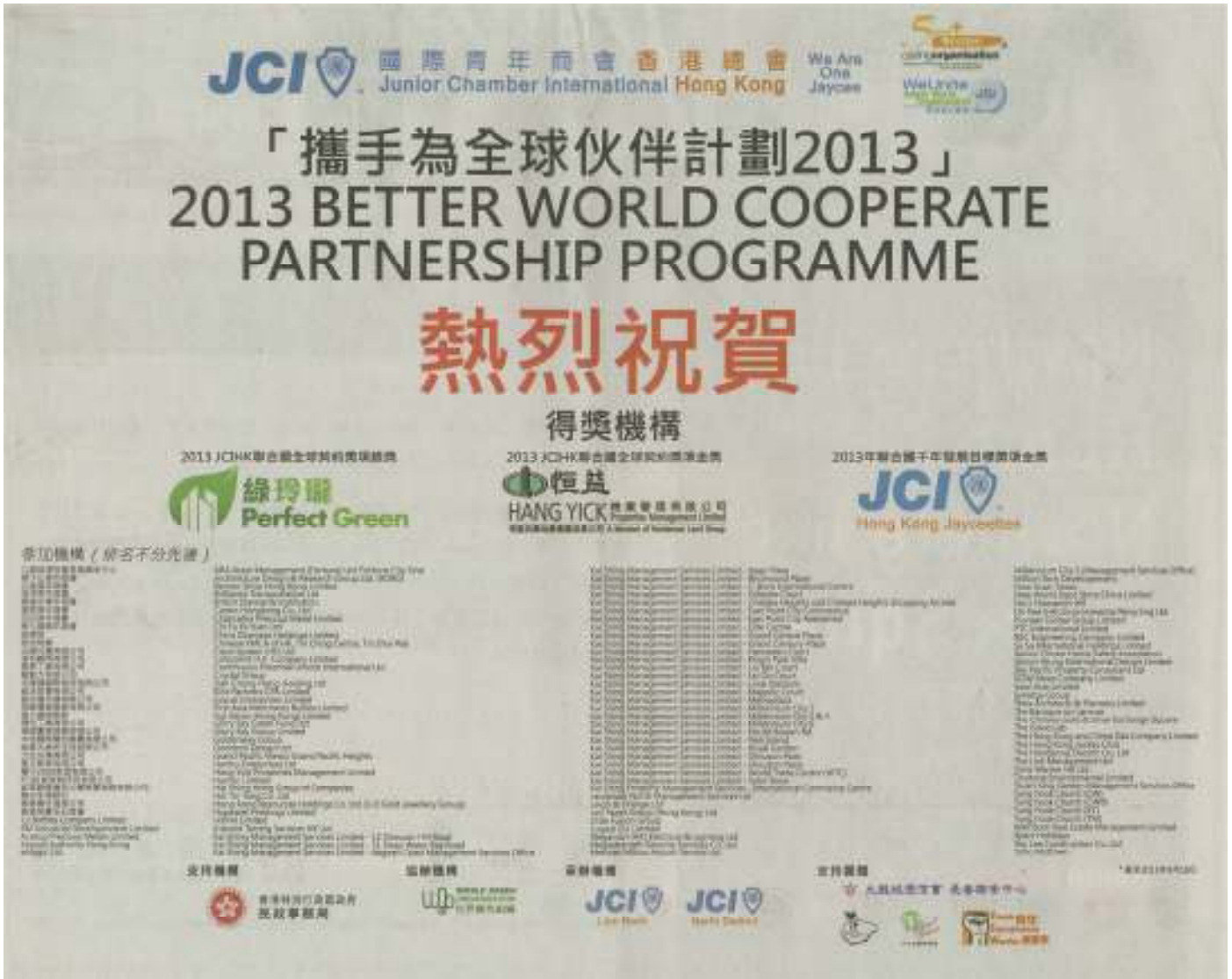
Announcement of awardees on newspaper